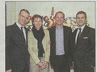
Die Partner von Singer Fössl Rechtsanwälte.